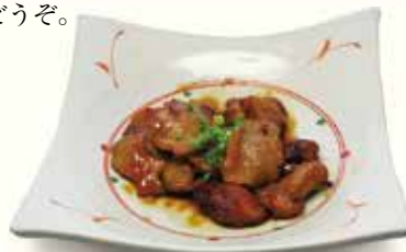
砂肝唐揚げオイスターソース掛け