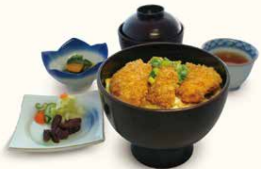
トロトロ玉子の輪島ふぐカツ丼