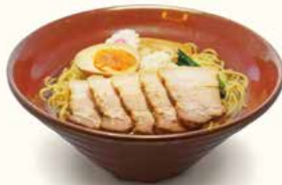
あごだし自家製チャーシュー麺

鶏がらスープの塩ラーメン ..... ¥1,000- 鶏がらを使った芳ばしい香りの手作りスープがクセになります。