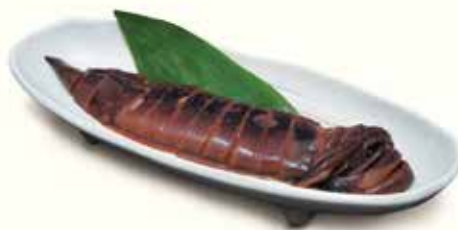
宇出津漁港のイカ沖漬け

一口揚げギョーザ (ニンニク風味) ..... ¥500- お好みでブラックペッパーと塩でもどうぞ。