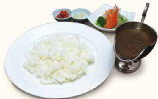
能登のスパイシービーフカレー