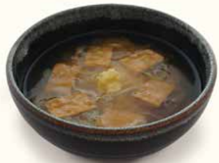
関西風あんかけうどん