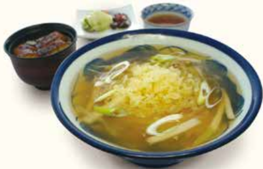
ミニうな丼とたぬきうどんセット

新商品 関西風あんかけうどん ..... ¥950- おあげとネギの関西風あんかけ。生姜も加わり体の芯までぽっかぽか。