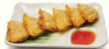
一口揚げギョーザ