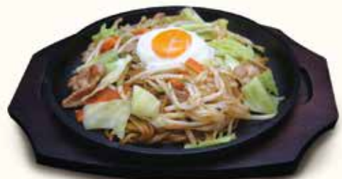
鉄板焼きジュージュー焼きそば