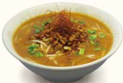
辛旨味噌ラーメン