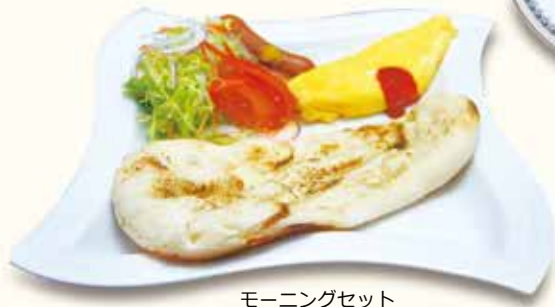
モーニングセット