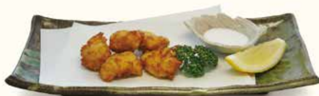
ふぐのサクサク唐揚げ

新商品 ふぐのサクサク唐揚げ〔おつまみ〕 ..... ¥900- 米粉を使ったヘルシー唐揚げ。輪島塩でお召し上がりください。